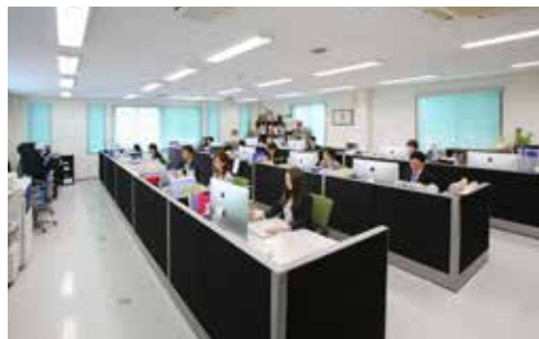
▲ DTPからWEBまで、充実した設備で表現します